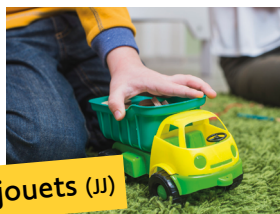
Jeux et jouets (JJ)