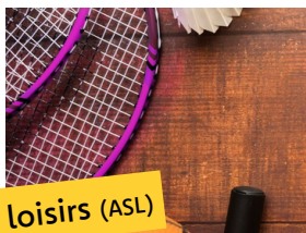
Sport et loisirs (ASL)

Pour répondre à l'obligation donnée par la nouvelle réglementation (loi AGEC) de nouvelles filières de tri sont mises en place dans les déchèteries du Haut-Doubs*: