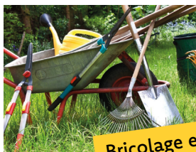
Bricolage et jardin (ABJ)