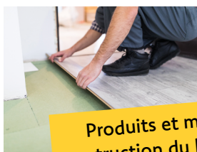
Produits et matériaux de construction du bâtiment (PMCB)

Le tri actuellement en place se trouve modifié par ces nouvelles filières.