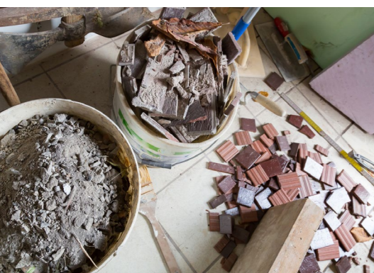
Artisans, commerçants, administrations, établissements publics, etc... sont redevables de la redevance spéciale

La redevance spéciale représente 165 000 €, soit moins de 5 % des recettes