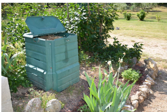
Le compostage p. 11