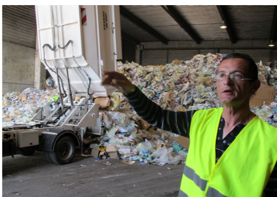
Escale au centre de tri p. 10