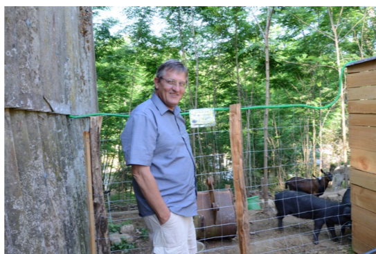
Rencontres p. 15-16-17