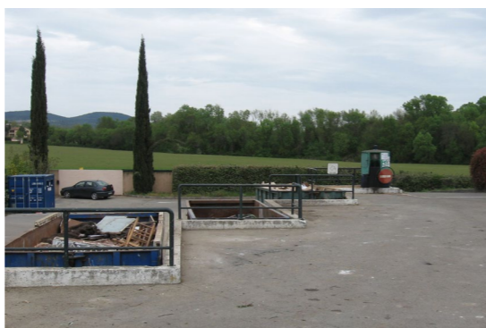
Escale à la déchèterie p. 8-9