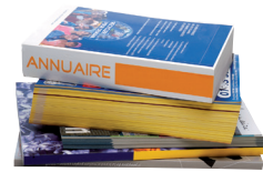
Catalogues - Annuaires