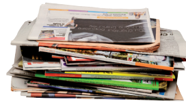
Journaux - Magazines

Inutile de les comprimer ou de les déchirer, d'enlever les agrafes, les spirales, etc. Elles seront retirées lors du recyclage.