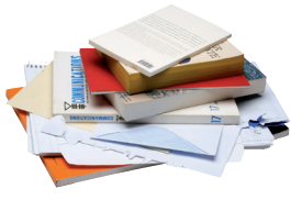
Tous les autres papiers