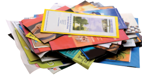
Publicités - Prospectus