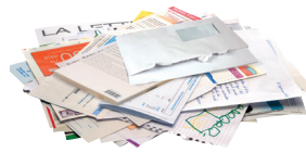
Courriers - Enveloppes