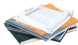
Cahiers - Bloc-notes