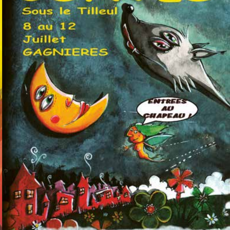
Illustration Eric Pomeroy