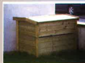
Exemple en version bois.

que l'on appelle le compost. Pour faire un bon compost, il faut bien mélanger les déchets, maintenir une certaine humidité et une bonne aération pour que les micro-organismes prolifèrent bien.