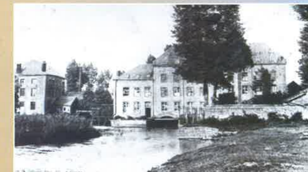
Ancienne manufacture de feutre.

Ne quittons pas Pouilly sans rappeler que la commune possède une faune et une flore exceptionnelles, dans un cadre magnifique offert par la boucle de la Meuse. Pouilly a su protéger sa nature, grâce à un marais-conservatoire de 9 ha en zone humide. La commune a d'autre part créé un verger communal à but pédagogique sur la côte de Châtillon en 2003 ; une trentaine d'arbres fruitiers y poussent désormais et présentent les variétés traditionnelles de notre région.