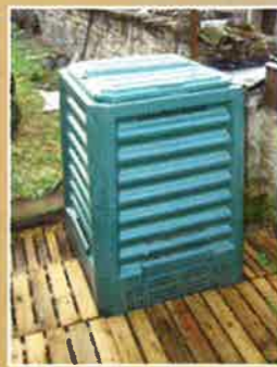
Exemple en version PVC.

Déposés dans un composteur, ces déchets vont, en présence de micro-organismes (vers, bactéries,...) se transformer en humus qui servira d'engrais naturel dans votre jardin et