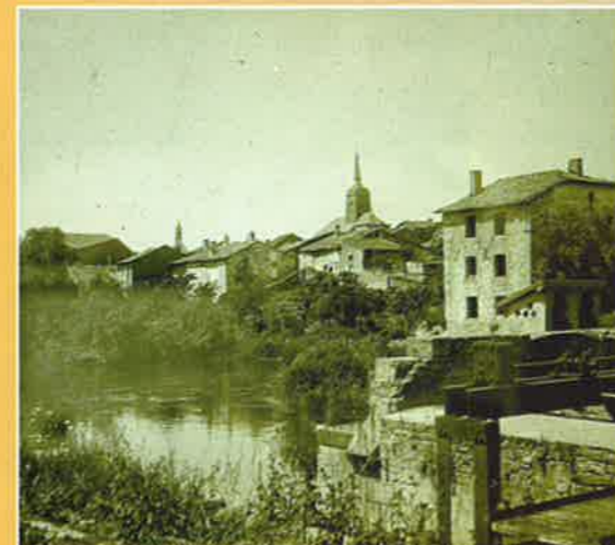
Vestiges du moulin vers 1930.