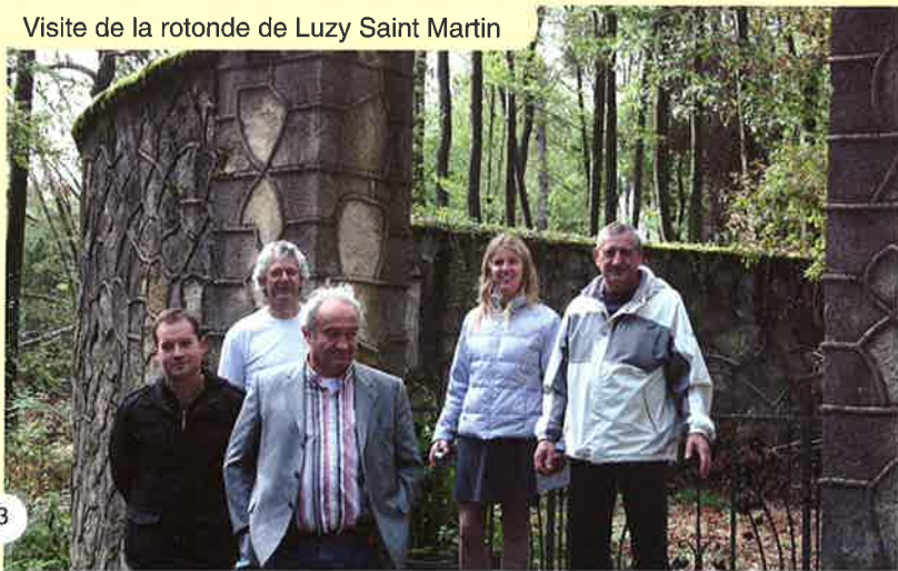
Visite de la rotonde de Luzy Saint Martin

Cette labellisation permettra à notre projet, ainsi qu'aux événements liés, d'être inscrit dans le calendrier des manifestations officielles de célébration du centenaire de la Première Guerre Mondiale en France.