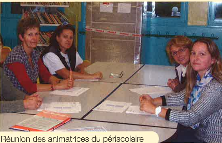
Réunion des animatrices du périscolaire