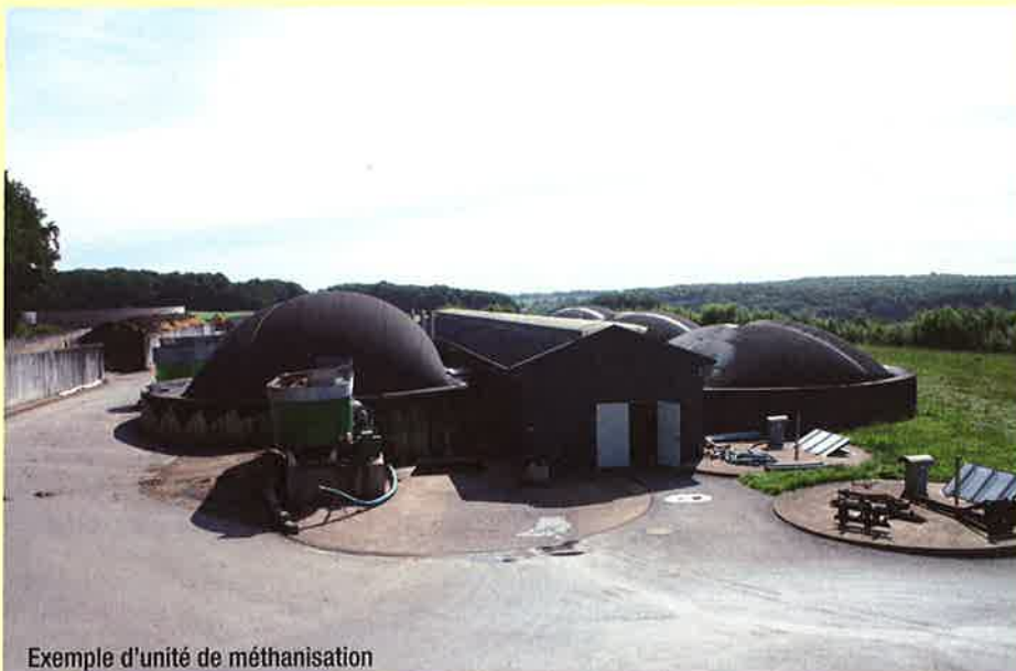
Exemple d'unité de méthanisation

Une solution, pour un traitement rapide des effluents d'élevage qui seraient restitués aux agriculteurs sous une forme concentrée rapidement assimilée par les cultures, réduisant ainsi le lessivage des nitrates et améliorant la qualité des eaux.