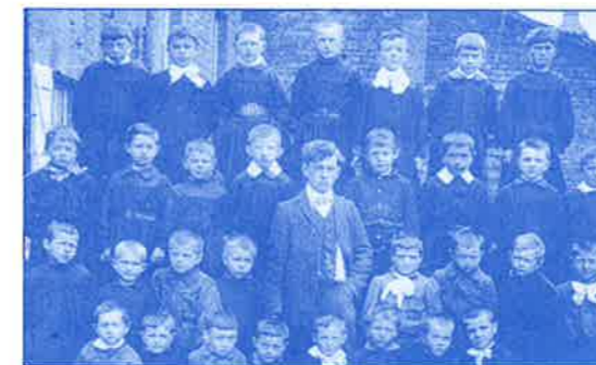
Ecole de garçons de Mouzay (1910).

Au début 19e du siècle, la plupart des écoles primaires furent placées sous la surveillance de l'évêque car les salles d'asile (classes maternelles) et écoles primaires de filles étaient confiées à des religieuses. Le 19e siècle est véritablement le siècle de l'éducation primaire avec une prise de conscience de son intérêt par les communes qui vont construire des bâtiments spécifiques. Mais le manque d'enseignants est crucial : à Stenay par exemple, la classe unique, aménagée dans le cloître de l'ancien couvent des Minimes, accueille de 165 à 185 élèves avec un seul maître !