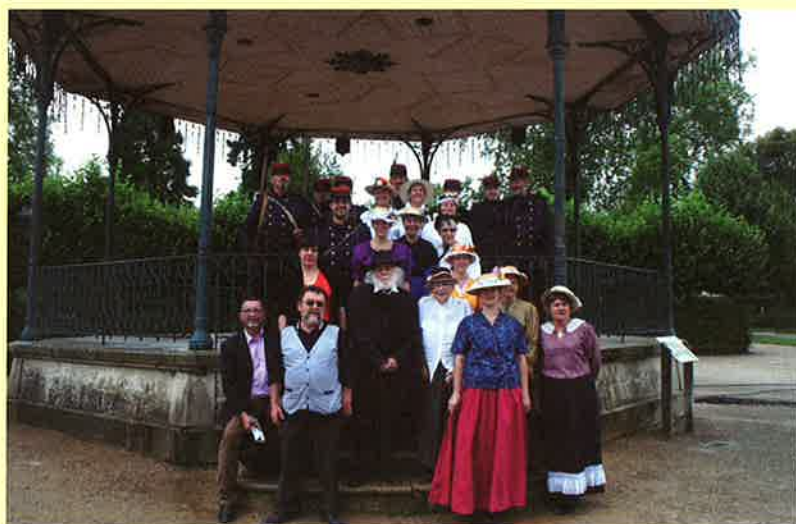
Délégation Meusienne à Alençon pour les cérémonies commémoratives.