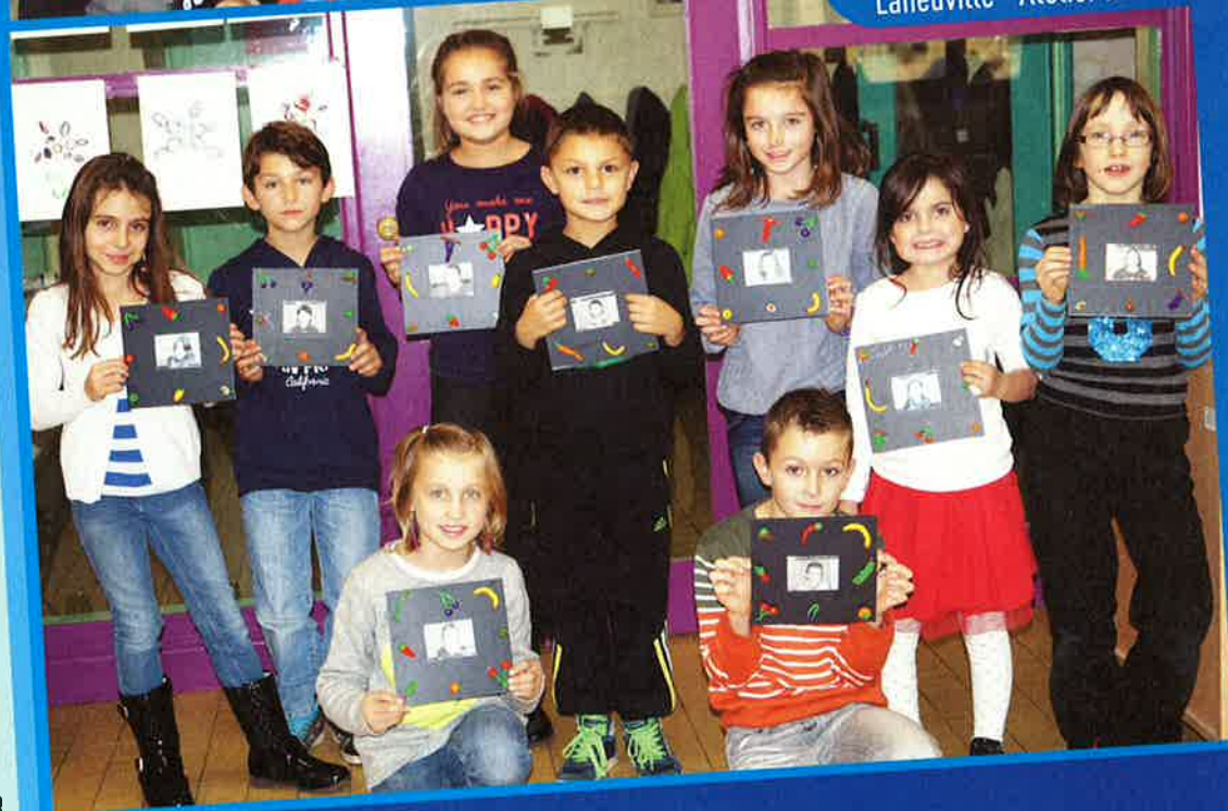
Autreville St Lambert - Baâlon - Beauclair - Beaufort - Brouennes Cesse - Halles sous les Côtes - Inor - Lamouilly - Laneuville sur Meuse Luzy Saint Martin - Martincourt - Moulins St Hubert - Mouzay - Nepvant Olizy sur Chiers - Pouilly sur Meuse - Stenay - Wiseppe