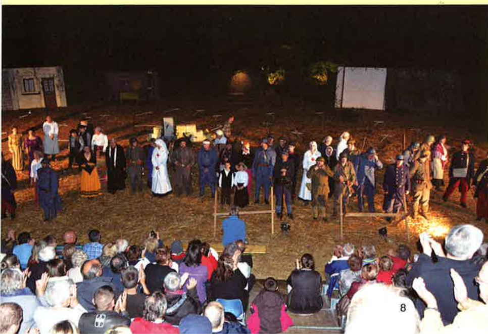
Spectacle des Chierothains

Les invités et participants ont tous après été conviés à une collation, suivie du spectacle « Du champ de blé au champ d'honneur », interprété par l'association LES CHIERO-THAINS, partenaire du projet européen INTERREG. Ce spectacle, joué par des bénévoles locaux, est basé sur des faits historiques et plus particulièrement sur les récits des batailles de Brandeville et de Luzy-Cesse. Les quatre représentations (deux à Brandeville et deux à Luzy) ont affiché presque complet. Ce sont ainsi plus de 1 400 spectateurs qui sont venus écouter et voir ce son et lumière.