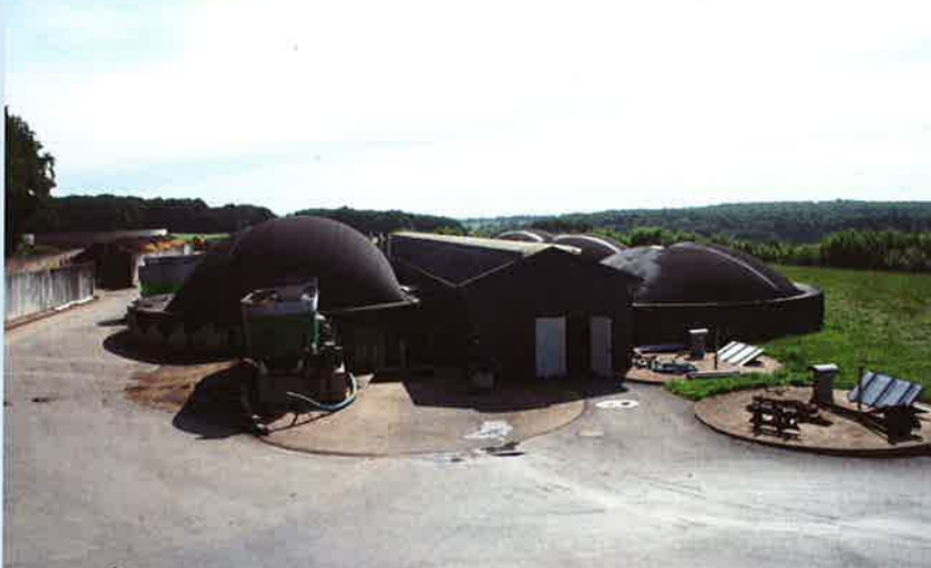
Unité de méthanisation

La CODECOM du Pays de Stenay est à l'affût d'autres appels à projets, émanant de l'Etat, dans l'objectif d'obtenir le maximum d'aides sur ses différents projets.