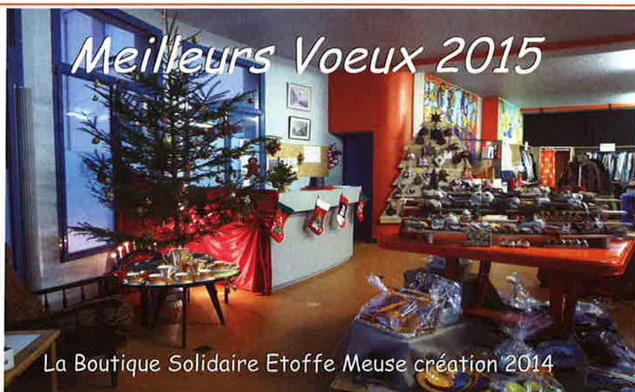
La Boutique Solidaire Etoffe Meuse création 2014

Toute l'équipe Bénévoles-Salariés du Centre Social de Stenay vous souhaite une très Bonne Année 2015