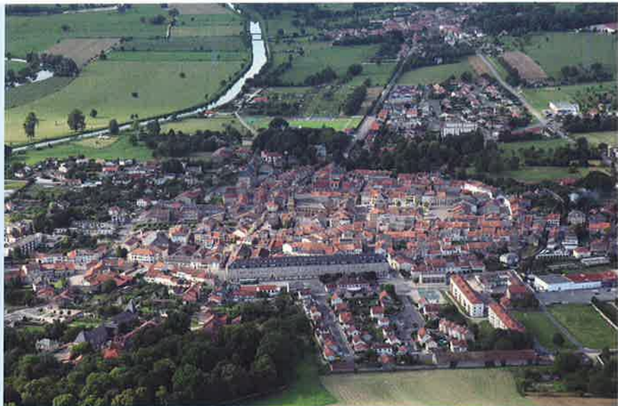
Stenay vue du ciel

L'Etat sollicite régulièrement les différents niveaux de territoires par le biais d'appels à projets ou d'appels à manifestation d'intérêts. Ce fut le cas pour les régions en 2010, avec la mise en place des Pôles de compétitivité. Pour la Lorraine, ce sont trois pôles qui se sont créés autour des matériaux (Materialia, en lien avec la Champagne-Ardenne) des fibres (en lien avec l'Alsace), et de l'écotechnologie (Hydreos, en lien avec l'Alsace).