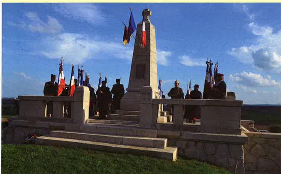
Cérémonie au monument franco-allemand de Luzy-Saint-Martin

Plusieurs événements se sont déroulés depuis le mois de septembre, sur notre territoire.