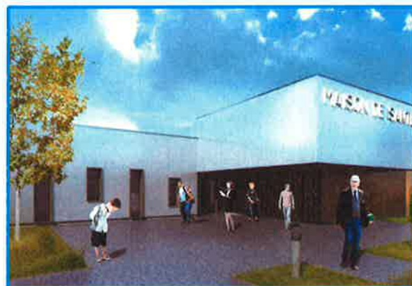
Vue de la future maison de santé du Pays de Stenay

Sélection d'un terrain, acquisition du terrain, réunions avec les professionnels de santé et l'architecte pour déterminer les besoins et préparer le permis de construire ; élaboration des conventions de location et suivi de la construction