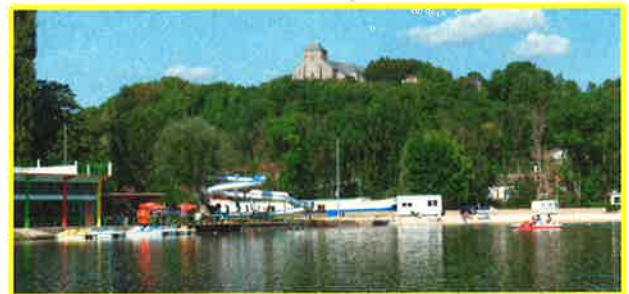
Le Lac Vert à Doulon