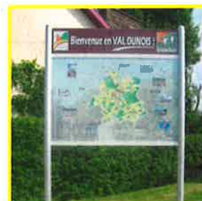
Signalétique du Val Dunois