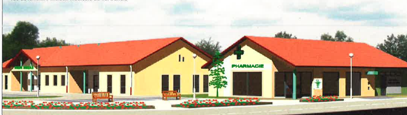
Vue de la future maison médicale du Val Dunois