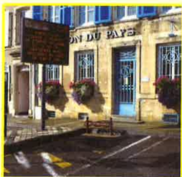
L'Office du Tourisme du Pays de Stenay