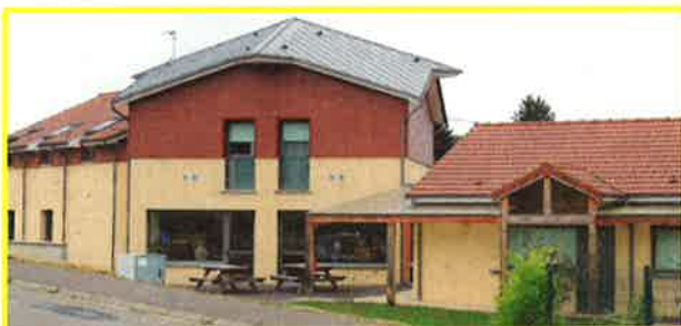
Hôtel le Râle des Genêts à Dun sur Meuse