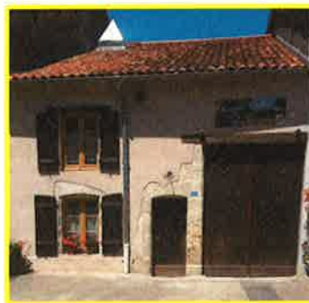
La Maison Vigneronne à Murvaux