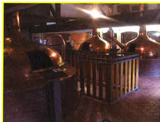
Le Musée Européen de la Bière

Aujourd'hui, le phénomène touristique du Pays est concentré sur ces sites, associant donc les associations que sont l'OTSI et le Groupement Archéologique, le Conseil Départemental pour l'exploitation et l'animation du Musée, sans oublier l'hôtellerie privée et la restauration