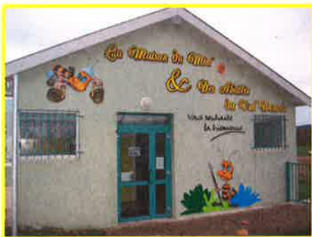
La Maison du Miel à Aincreville

Le développement du tourisme au sein de la nouvelle CODECOM doit reposer sur le recentrage des actions du nouvel Office de Tourisme afin que ses missions tournent autour de l'éco-tourisme et non de l'animation locale qui est du domaine des associations.