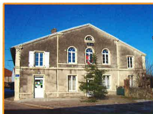
Sassy sur Meuse