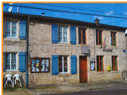
Fontaines St Clair

Aujourd'hui, cette compétence se résume à la gestion des 52 logements mais pourrait évoluer vers une politique d'économie d'énergie, vers une nouvelle OPAH afin d'améliorer l'habitat privé et locatif, la création de lotissement... sans pour autant empêcher la réhabilitation de logements communaux sans intérêts communautaires et à la charge des collectivités.