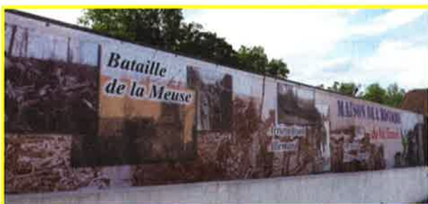
La Maison de l'Histoire à Doulon