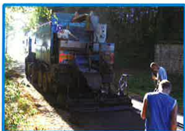
Mise en place de l'enrobé coulé à froid