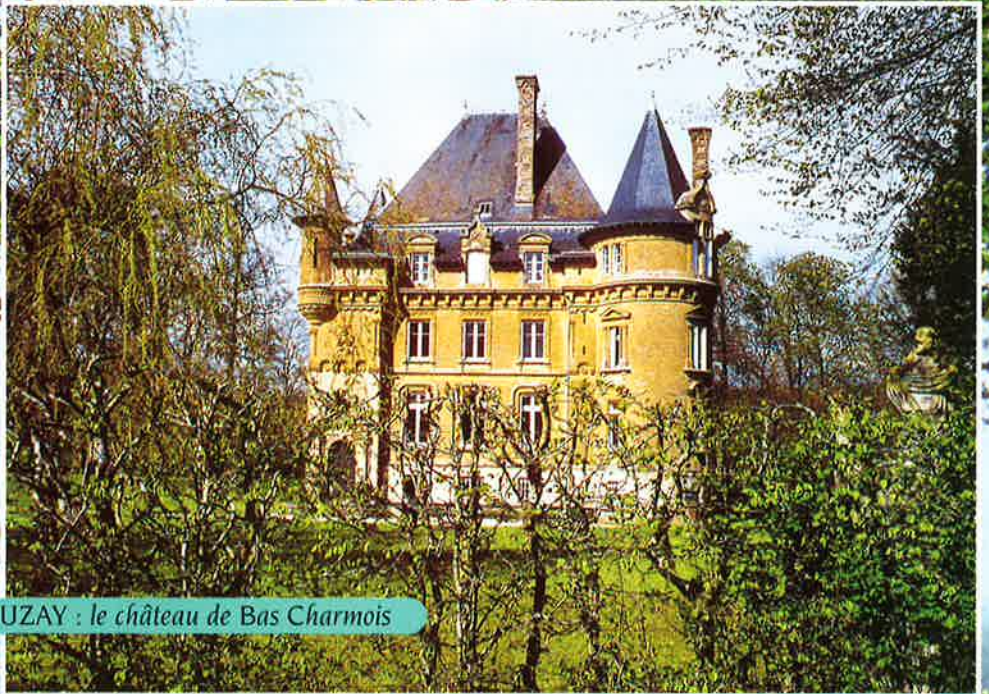
MOUZAY : le château de Bas Charmois