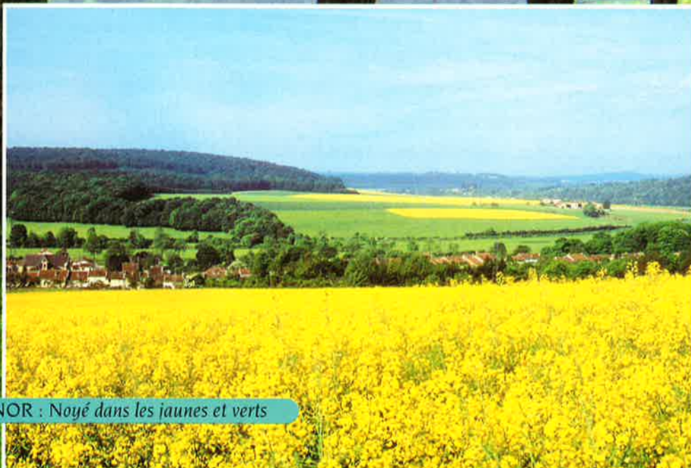
INOR : Noyé dans les jaunes et verts