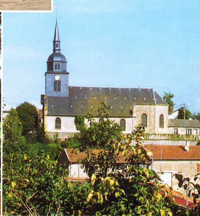
L'église de Bâalon