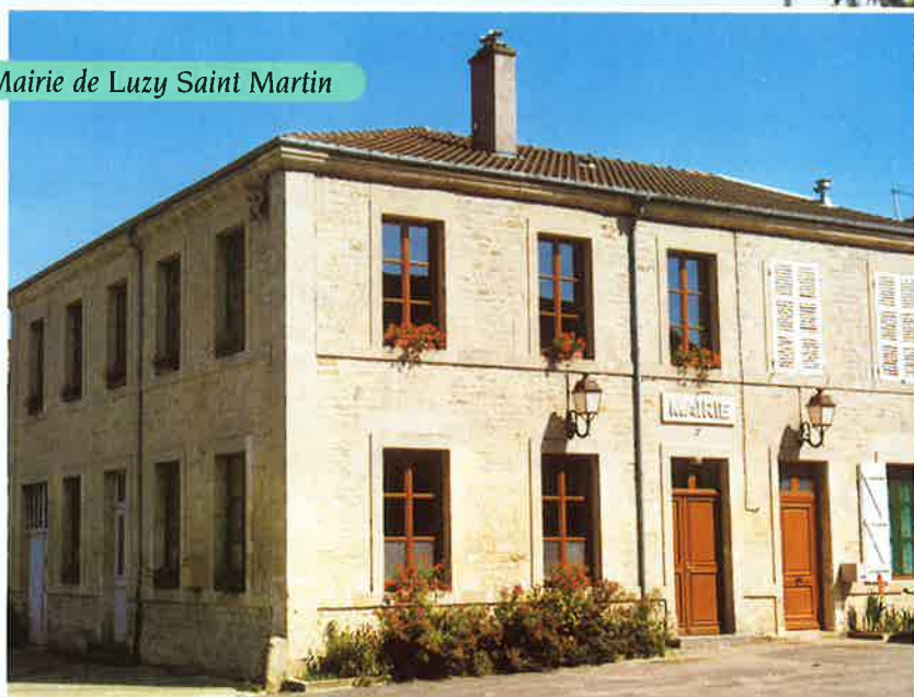
La Mairie de Luzy Saint Martin