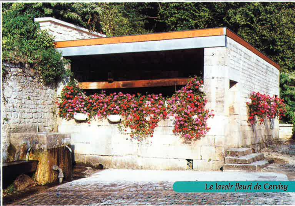
Le lavoir fleuri de Cervisy