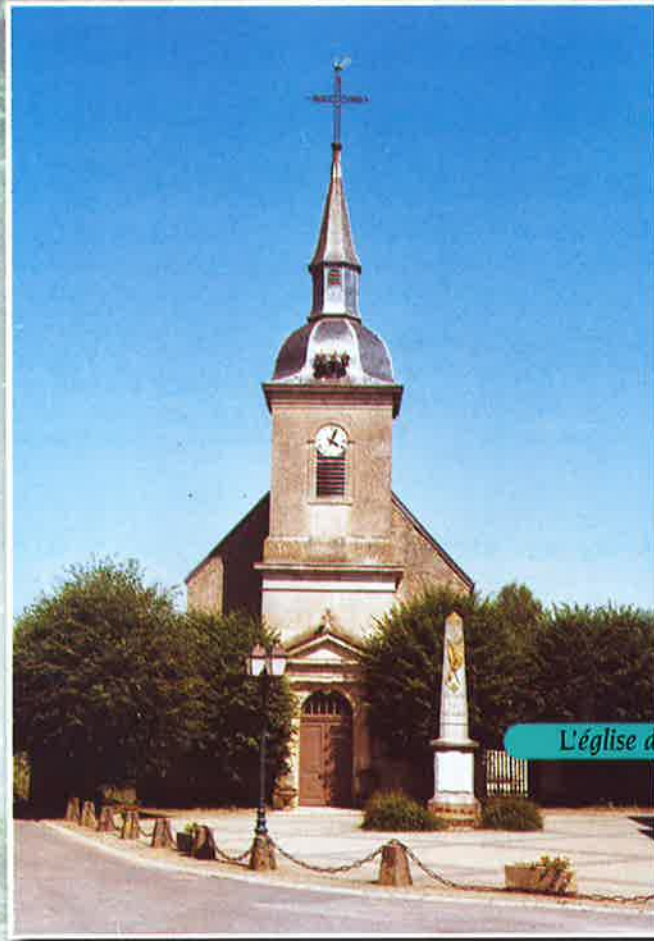
L'église de Luzy St Martin