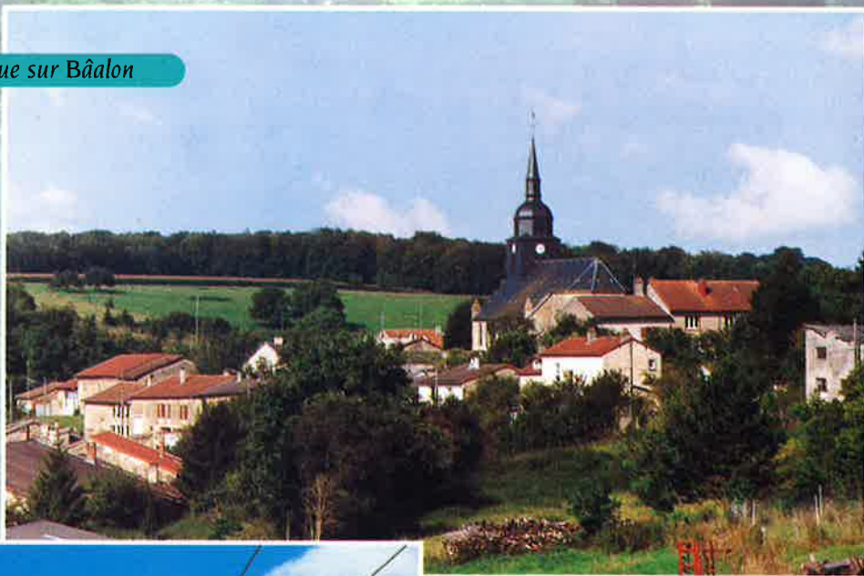
Vue sur Bâalon