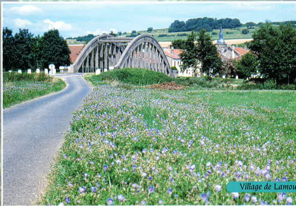
Village de Lamouilly