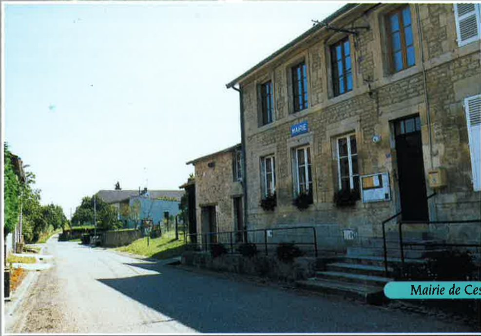
Mairie de Cesse