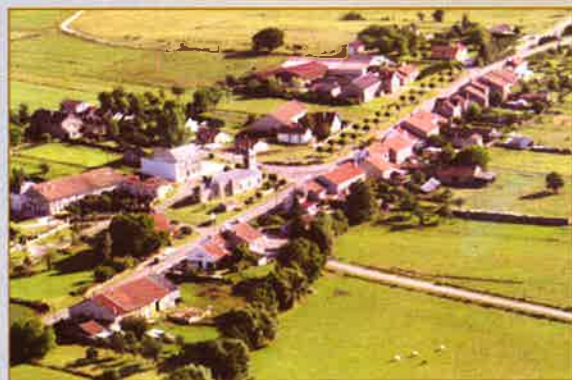
Vue aérienne.

Placée sur la route reliant Paris et Reims à Luxembourg, la commune de Beauclair possède une superficie relativement faible (484 ha). Le ruisseau de l'Anelle, qui descend d'une vallée étroite creusée dans les Côtes de Meuse, servait jadis à plusieurs activités économiques du village. Curieusement, la commune possède une forêt sur les Côtes de Meuse, qui culminent ici à 308 m. Le village est un village-rue typique, avec ses usoirs ; il n'y avait qu'une seule rue à l'origine, le long de la nationale, mais récemment, le village s'est étendu vers Halles-sous-les-Côtes. « Beauclair est un village qui vient d'améliorer son aspect visuel en réalisant plusieurs grosses tranches de travaux, notamment avec un aménagement fonctionnel et paysager de ses usoirs, ainsi que par l'enfouissement des réseaux électriques, téléphoniques et la réfection totale de l'éclairage public » (François Watrin).