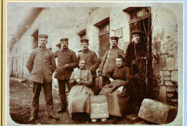
Civils français et militaires allemands à Beaufort en 1915.