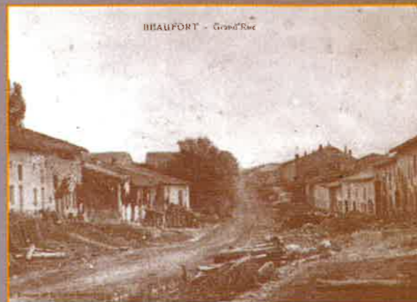
Rue du Bourg de VILLERS.

Créé en 1986 à l'initiative de la Mutualité Sociale Agricole et de ses partenaires, Présence Verte est un système de télésurveillance ouvert à tous les publics. Bénéficiant d'une longue expérience, Présence Verte se caractérise par une approche humaine et son professionnalisme, basé sur un conseiller local, professionnel de l'assistance, un réseau de solidarité composé de proches choisis par l'abonné et des interlocuteurs présents 24 heures sur 24, 7 jours sur 7, qui réceptionnent, identifient et traitent les appels, rassurent et organisent les secours. Pour tous renseignements, appeler le 0 800 00 89 89 (numéro vert).