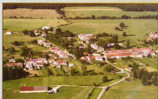
Vue aérienne.

Beaufort-en-Argonne est un petit village blotti à l'orée de l'immense forêt du Dieulet. L'actuel territoire de la commune (1.100 ha) résulte d'un essartage (ou défrichement) de cette forêt au cours des siècles, d'où les fréquents toponymes sarts relevés sur le plan communal. Beaufort est la plus ancienne commune libre du département puisque sa charte d'affranchissement date de 1188. Elle était administrée par une communauté d'échevins et non par un seigneur. Le village possède quelques vestiges anciens, comme le château et le moulin. La population (178 habitants) est stable depuis plusieurs années. L'activité principale est surtout tournée vers l'agriculture (une dizaine d'exploitations agricoles) mais de nombreux salariés sont occupés dans les industries locales, la papeterie de Stenay et la laiterie de Cléry (Guy SANTOIRE).