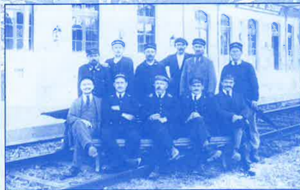
Personnel de la Gare de Stenay.

Le canton de Stenay accueille son premier train à Lamouilly en 1862, après l'extension de la ligne Sedan - Carignan (ouverte en 1861). A partir de cette date, les habitants purent donc se rendre à Charleville et Lille ou Paris dans un sens, et Montmédy, Longwy et Metz dans l'autre sens. Mais les Stenaisiens devaient aller prendre le train à Lamouilly ou Chauvency, grâce à des liaisons par calèche. Cette ligne est toujours active. Elle permet de joindre Paris ou le nord de la France, Strasbourg, l'Allemagne, la Suisse ou le midi... Véritable épine dorsale de la sidérurgie lorraine, elle a été électrifiée en 1955, mais elle a perdu de son importance depuis la fermeture du bassin de Longwy.