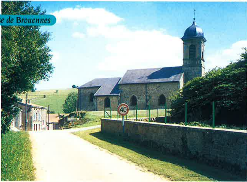
L'église de Brouennes