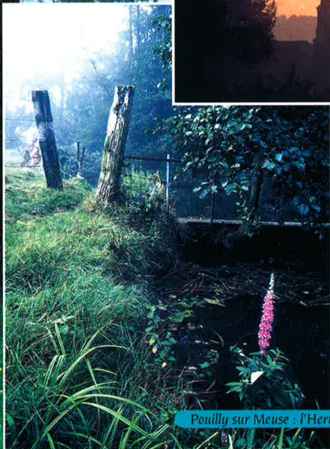
Pouilly sur Meuse : l'Herminie