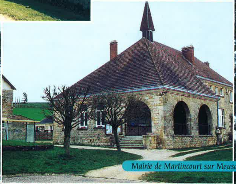
Mairie de Martincourt sur Meuse