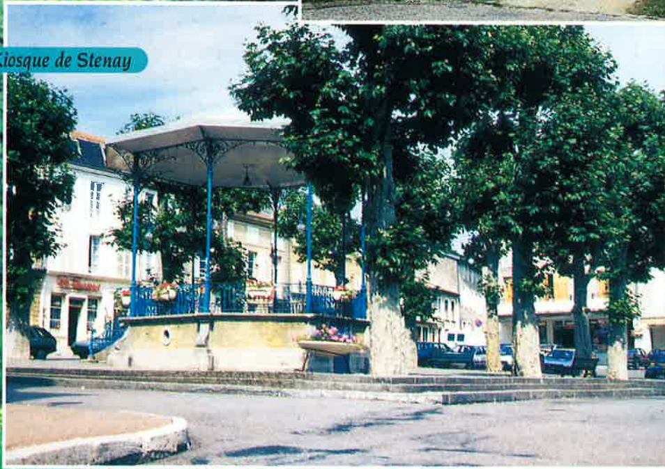
Le Kiosque de Stenay