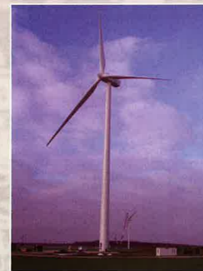
Construction des éoliennes (2007).

qui entraîna le départ de nombreuses familles. Enfin, la fermeture de la forge (2003) marqua la fin d'une époque mais donne peut-être aussi à notre ville les bases d'un renouveau, alors que ce développe sa nouvelle vocation de bourg-centre.