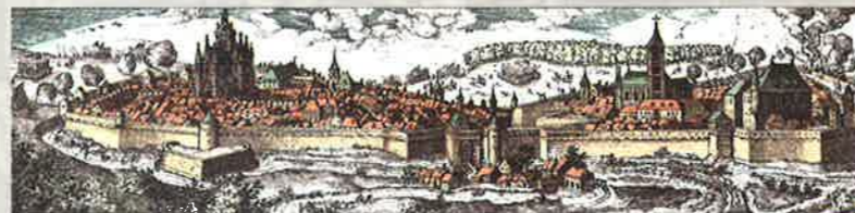
Stenay vers 1590.

une nouvelle chapelle qui porta désormais son nom.