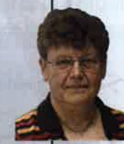
BUSQUANT Annick Membre du bureau Maire de Laneuville sur Meuse