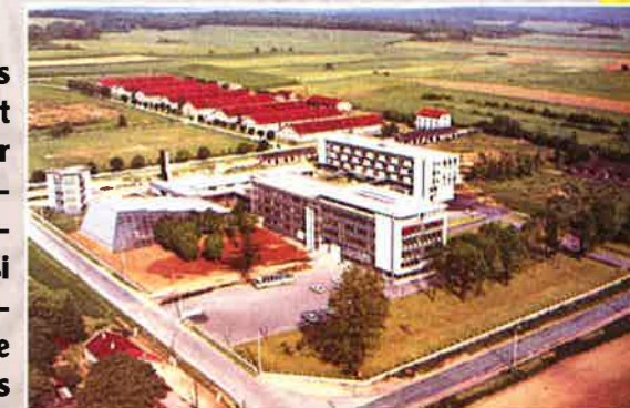
Collège et lycée au moment de leur construction.

Si les années 1960 furent imprégnées par cet essor économique et démographique, ainsi que par l'ouverture du lycée (1968), le Pays de Stenay subit successivement la fermeture de la base de Marville (1967), le départ des gardes mobiles (1971), la crise du bassin sidérurgique de Longwy, ce