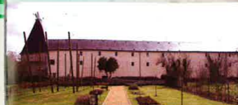
Ancien magasin aux vivres de la citadelle.

De nombreux immeubles du centre-ville furent remaniés et mis au goût du jour. D'inspiration Renaissance, ils supportent les premières mansardes. Mais c'est aussi de cette période que date la destruction progressive des arcades. Stenay quitta progressivement l'orbite lorraine à partir de 1632 avec une première occupation par les troupes françaises. Cependant, les troubles de la Fronde constituèrent une révolte contre le roi de France : Stenay devint la capitale des Frondeurs, ce qui aboutit au grand siège de 1654 par Louis XIV. La ville passa définitivement dans le giron de la France, entraînant la démolition des fortifications en 1687, alors qu'une longue période de récession s'ouvrait, qui ne se terminera que vers 1750.