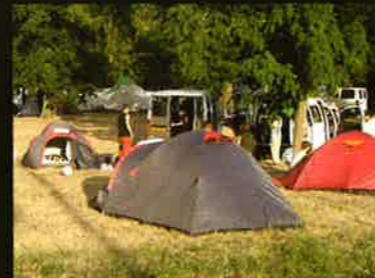
Camp Langeac Rafting - Kayak