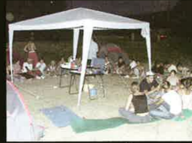
35 Jeunes autour d'un repas à 750 Kms de Stenay