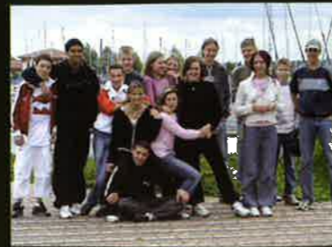
Camp Lac du Der

Pour tout renseignement, contacter Manu : Centre Social et Culturel du canton de Stenay 03 29 80 39 08 Foyer des jeunes de Stenay 03 29 80 47 41 Sur son portable 06 16 26 71 48