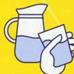
BUVEZ DE L'EAU