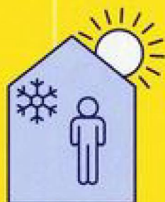
RESTEZ AU FRAIS