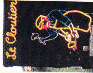
Ancien métier de la région

Grâce au travail de chacun et à l'apport d'idées nouvelles, ces illuminations font l'émerveillement des visiteurs, petits et grands, toujours plus nombreux d'année en année. Devant l'ampleur de cet événement, des parkings ont été aménagés pour les visiteurs.