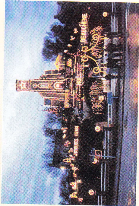
La colline illuminée