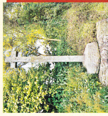
Calvaire ancien dans le bourg