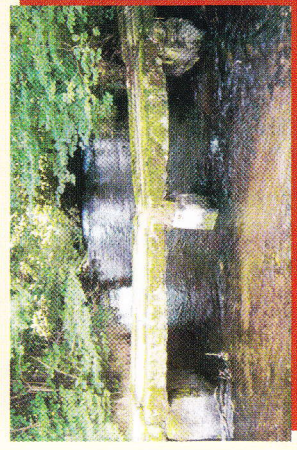
Pont dit « Romain » au « Gué de La Motte » (hors circuit)