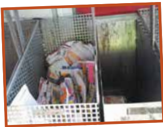
TRI DES MATÉRIAUX SELON CATÉGORIES : PLASTIQUES, PAPIERS, MÉTAL...