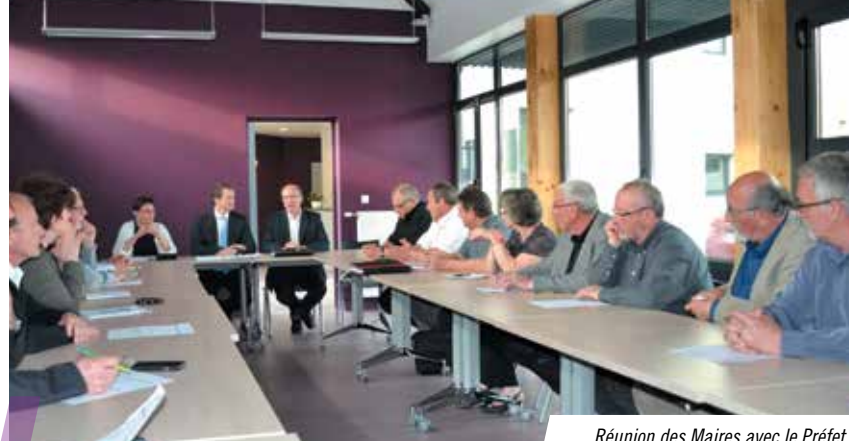
Réunion des Maires avec le Préfet.

Centre Hospitalier de Verdun - Saint-Mihiel 2 place Jean BERAIN - 55300 SAINT-MIHIEL Tél. : 03 29 91 81 81 (poste 1433)