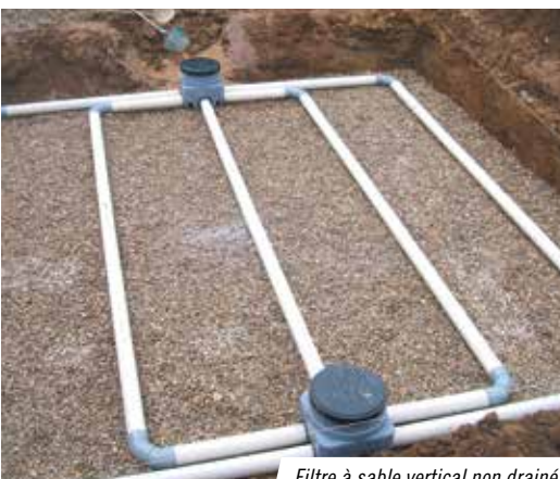
Filtre à sable vertical non drainé.