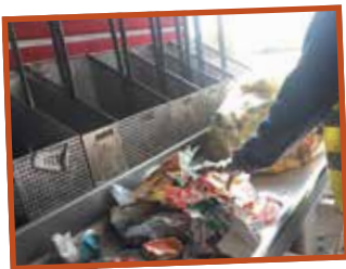
TRI MANUEL DES MATÉRIAUX