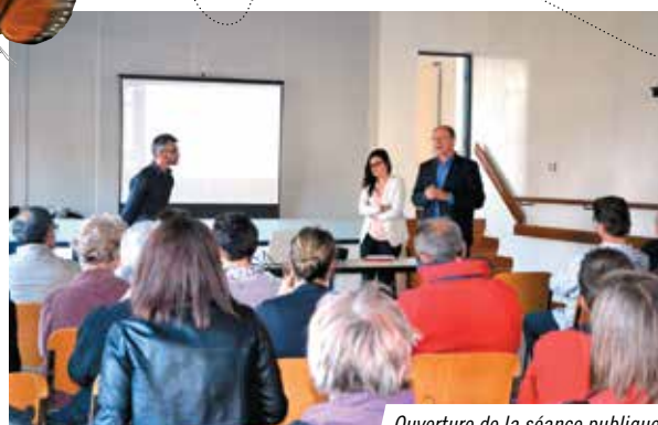
Ouverture de la séance publique.