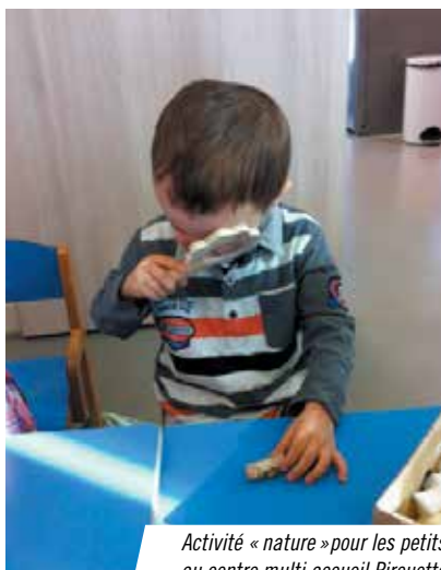
Activité « nature » pour les petits au centre multi accueil Pirouette