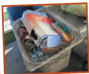
REFUS DE TRI = DÉCHETS ENFOUIS !