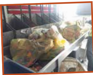
ÉCHANTILLON DE SACS DE TRI DE LA CODECOM PRIS AU HASARD POUR ANALYSE : C'EST LA CARACTÉRISATION