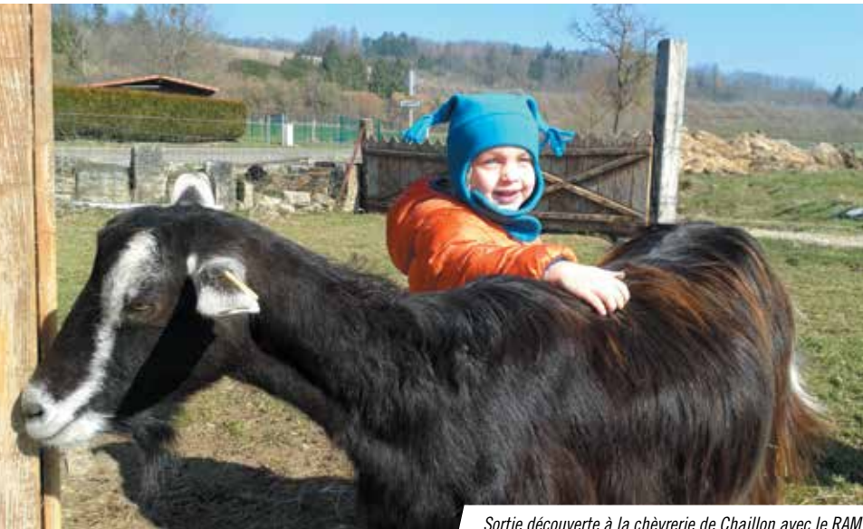
Sortie découverte à la chèvrerie de Chaillon avec le RAM.