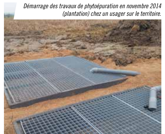
Démarrage des travaux de phytoépuration en novembre 2014 (plantation) chez un usager sur le territoire.