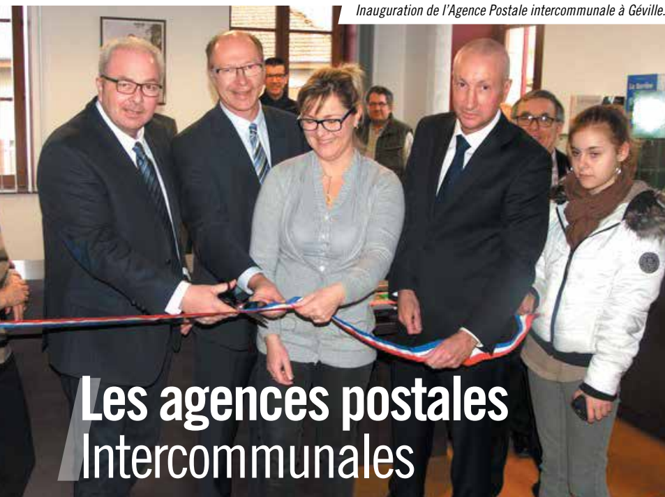
Inauguration de l'Agence Postale intercommunale à Géville.

La journée s'est terminée par une rencontre avec les Maires de la Codecom. De nombreux dossiers ont été abordés, comme les projets en cours sur notre territoire, autour de la santé, de l'habitat et du haut-débit. Il a été évoqué également les problématiques liées à la baisse des dotations de l'état qui pèse lourdement sur nos finances et la représentation des communes au conseil communautaire qui sera modifiée en cours de mandat.