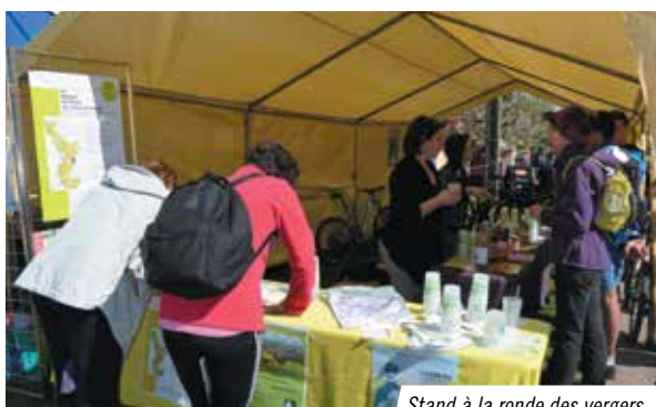
Stand à la ronde des vergers.