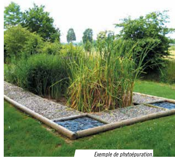
Exemple de phytoépuration.

Sur notre territoire, il existe un exemple concret de phytoépuration sur le secteur de Géville. Le SPANC va suivre l'évolution de ce système à titre d'exemple, car il a été mis en place en novembre 2014.