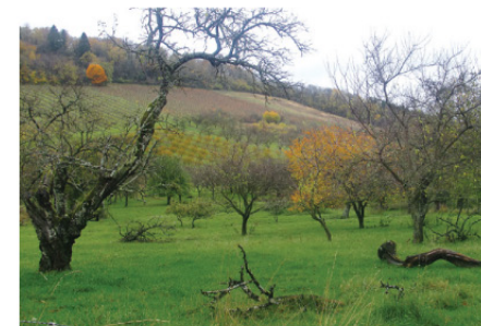
Paysage de Côtes.

7 Redescendre vers le village des Éparges en empruntant le sentier pénétrant dans la forêt par Larvau (passages boueux). Atteindre la ferme du Sonvaux, franchir sur un pont le Longeau, puis déboucher sur la D 154. Tourner à droite vers la mairie et rejoindre le point de départ.