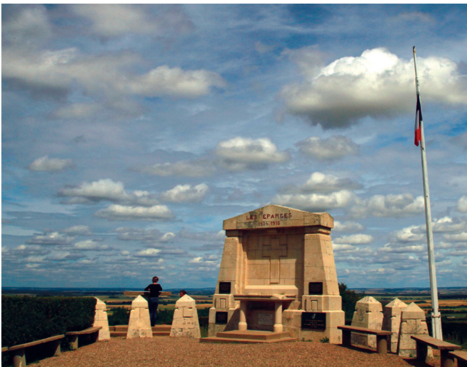
Le monument du Point X.

Rejoignez-nous et randonnez l'esprit libre