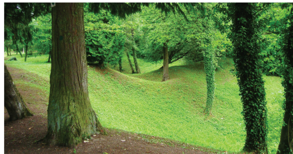
L'éperon des Éparges.

FFRandonnée les chemins, une richesse partagée www.ffrandonnee.fr