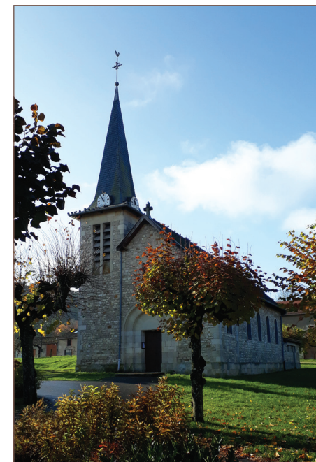
Église Saint-Étienne de Combres-sous-les-Côtes

6 En arrivant, se diriger à gauche [👁 > église Saint-Vanne], longer par la droite la place des Platanes [👁 > calvaire]. Sur la droite, franchir un petit ruisseau et retrouver le point de départ.