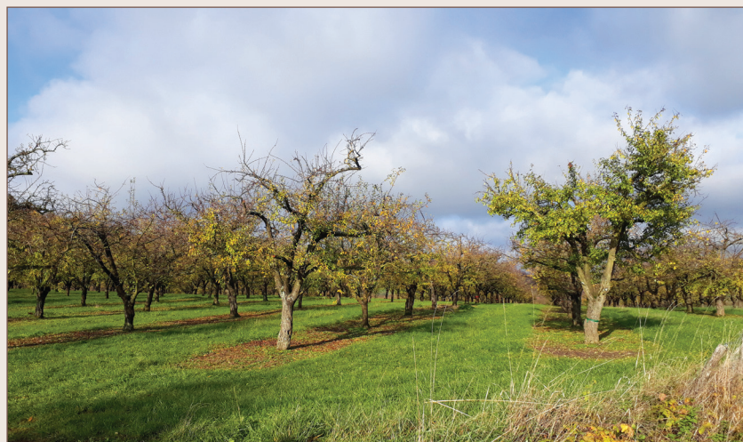
Un verger de mirabelliers, à Herbeuville