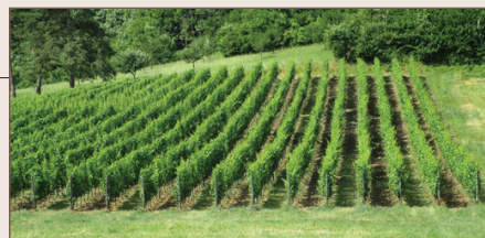
Une parcelle de vigne du domaine de Muzy

Enracinée en Meuse depuis l'époque gallo-romaine, la culture de la vigne sera développée au fil des siècles par les moines (et hommes d'église) et connaîtra son apogée au cours du XIX e siècle. Le département sera alors parmi les plus viticoles de France avec 13 700 hectares. Après avoir été décimé par les guerres et le phylloxera, le vignoble des Côtes de Meuse renaît dans les années 1970. Un sol argilo-calcaire, un micro-climat, une variété de terroirs, de belles expositions en pente douce (sud, sud-est) font des Côtes de Meuse un écrin pour la vigne.