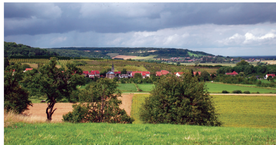
Paysage en chemin.

FFRandonnée les chemins, une richesse partagée www.ffrandonnee.fr