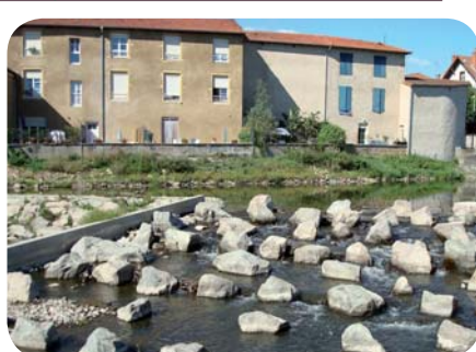
Passe à poissons un an après