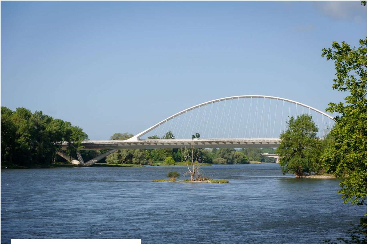
Pont de l'Europe à Orléans.