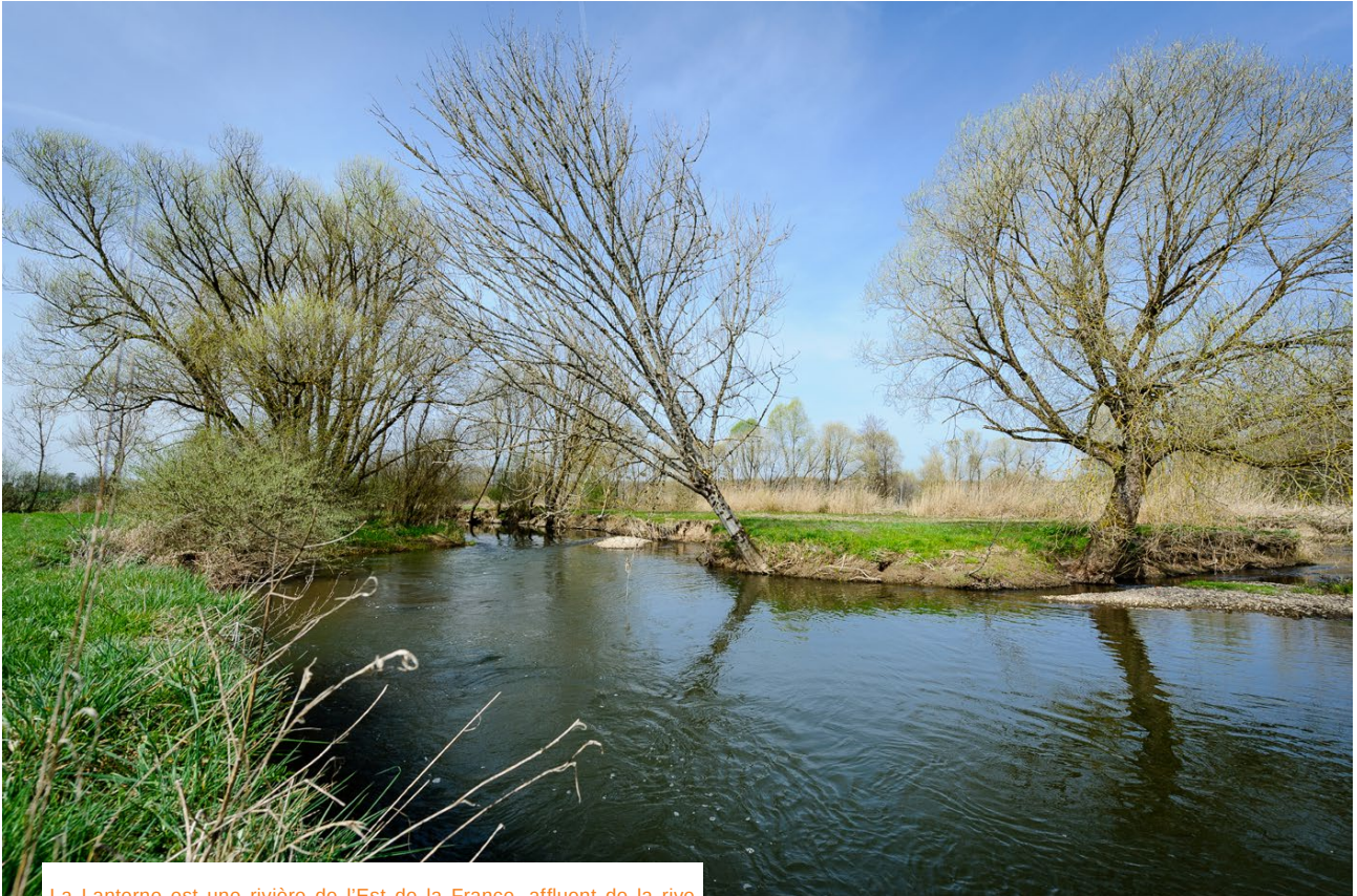
La Lanterne est une rivière de l'Est de la France, affluent de la rive gauche de la Saône, et sous-affluent du Rhône.