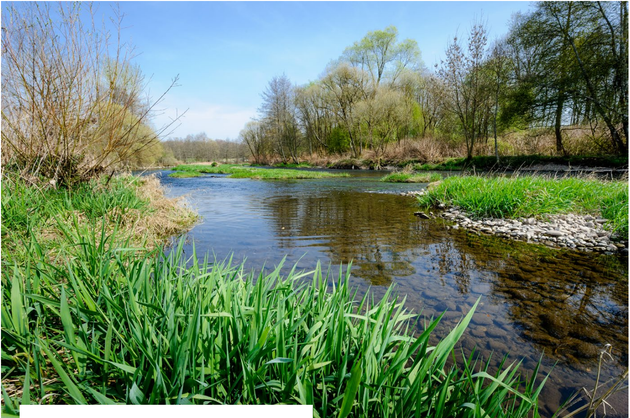
Ruisseau «Le Morbief» à La Corveraine (70)