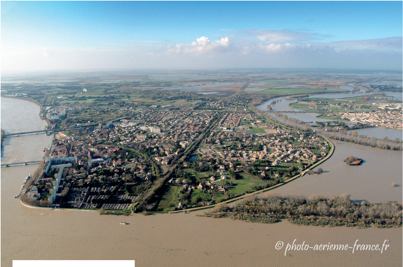
Le quartier Trinquetaille d'Arles