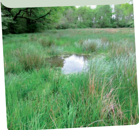
Belle mare prairiale

Tout cet ensemble de milieux humides et aquatiques forme un réseau dense avec des fonctions naturelles indispensables qui rendent de nombreux services à la population.