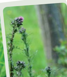
Cirse des marais