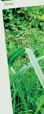
Scirpe des bois