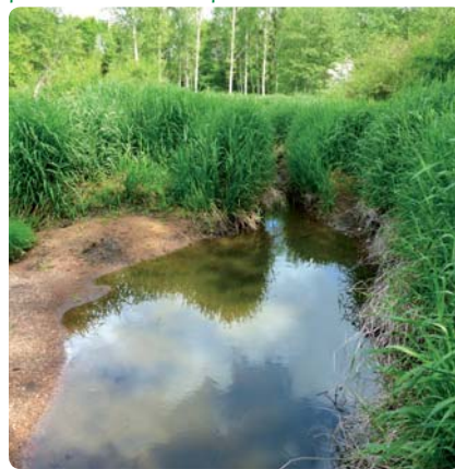
Zone alluviale gorgée d'eau de crues

Elles sont particulièrement bienvenues en période sèche et sont essentielles à la production d'eau potable.