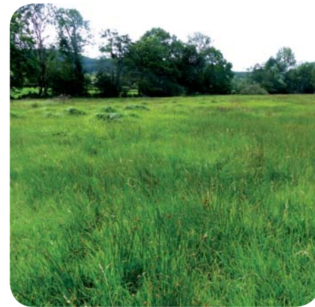
Belle prairie pâturée typique sur le territoire, en bon état de conservation