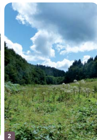
Zone en moyen état de conservation, en cours de fermeture du milieu, c'est-à-dire qu'elle se transforme en forêt (évolution d'une même parcelle 1 en quelques années 2 suite à l'abandon du pâturage)

Suivant le niveau d'impacts observé, les zones humides vont perdre leurs fonctions naturelles, et les services rendus par ces milieux seront amoindris voire complètement altérés. Les zones humides sont parfois abandonnées par l'agriculture car trop difficiles à exploiter et ont alors tendance à se fermer naturellement. Au fil du temps, cette évolution va assécher la zone humide qui perdra alors ses fonctions naturelles globales !