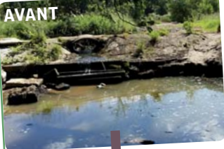
Seuil de la Fleur de Lierre