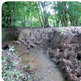
Zone en mauvais état de conservation, très impactée par le surpâturage