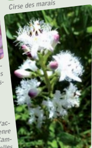
Trèfle d'eau : typique de zones gorgées d'eau très rares, dites "tourbeuses".