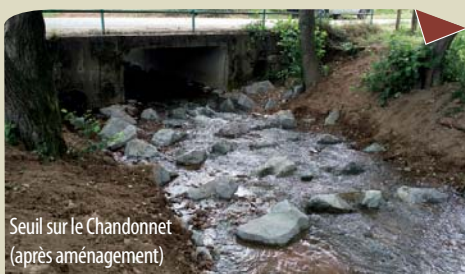
Seuil sur le Chandonnet (après aménagement)