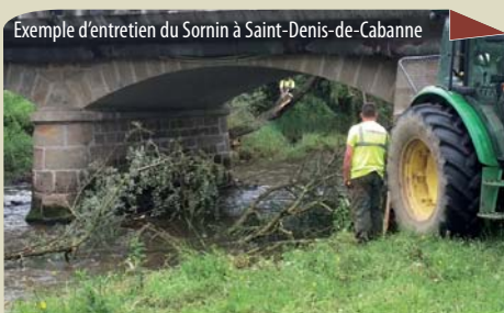
Exemple d'entretien du Sornin à Saint-Denis-de-Cabanne

Entretien de la végétation des berges, en priorité dans les zones urbanisées : élagage, recépage, abattage des arbres malades... L'entretien des secteurs clôturés et plantés lors des précédents programmes est également prévu. Ainsi des interventions sont programmées sur le Jarnossin amont et médian, le Chandonnet aval, l'axe Sornin, le Botoret... Réalisation : équipe rivière du SYMISOA et de Charlieu Belmont Communauté