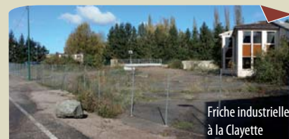
Friche industrielle à la Clayette

Réalisation fin 2018 : SYMISOA et la Communauté de Communes La Clayette Chauffailles en Brionnais