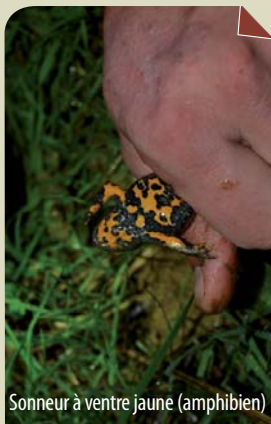
Sonneur à ventre jaune (amphibien)