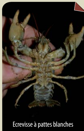
Ecrevisse à pattes blanches