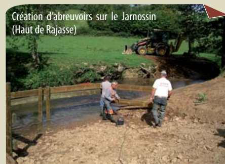
Création d'abreuvoirs sur le Jarnossin (Haut de Rajasse)

Pose de clôtures en retrait, aménagement d'abreuvoirs et de passerelles, plantations pour reconstituer la ripisylve en bord de rivière. Réalisation : équipe rivière du SYMISOA et de Charlieu Belmont Communauté