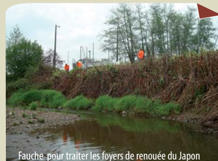
Fauche pour traiter les foyers de renouée du Japon

Réalisation : équipe rivière du SYMISOA et de Charlieu Belmont Communauté