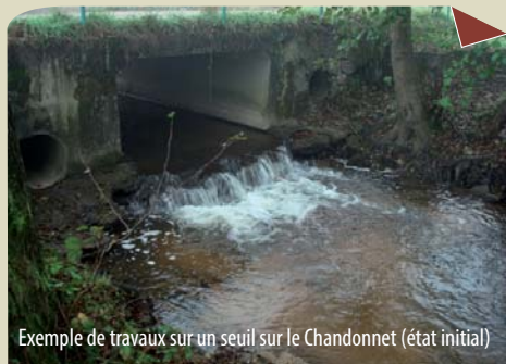
Exemple de travaux sur un seuil sur le Chandonnet (état initial)

Effacement ou aménagement de seuils pour permettre le passage des poissons et le transport naturel des sédiments. Plusieurs petits ouvrages au programme sur le bassin du Sornin. Sur le Jarnossin, 3 ouvrages concernés cette année, dont le contournement du moulin de Jarnosse qui allie restauration de la continuité et préservation du patrimoine bâti. Réalisation : équipe rivière du SYMISOA et de Charlieu Belmont Communauté