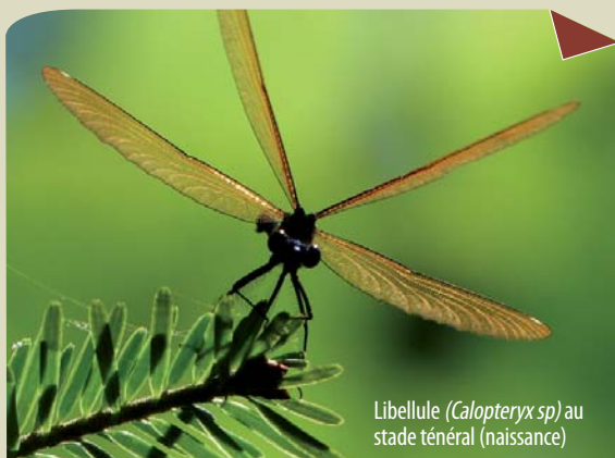
Libellule ( Calopteryx sp) au stade ténéral (naissance)