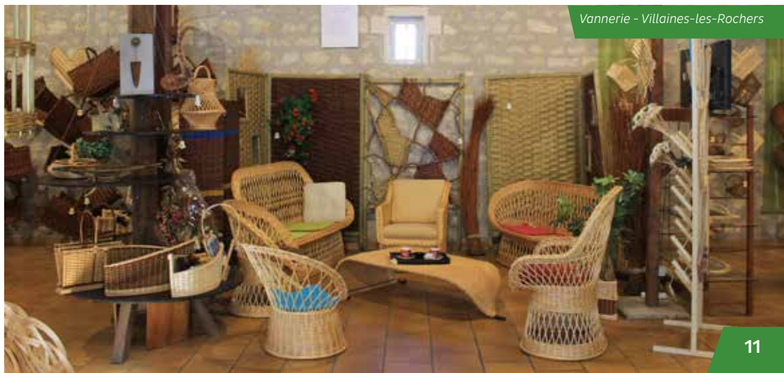
Vannerie - Villaines-les-Rochers