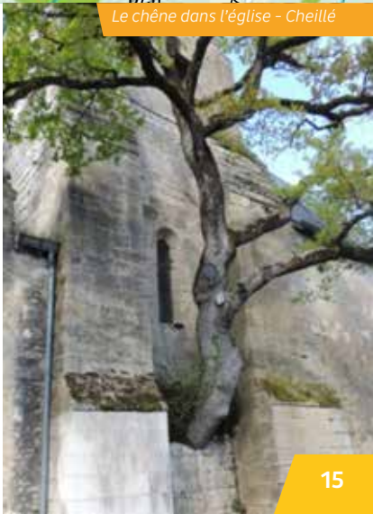
Le chêne dans l'église - Cheillé