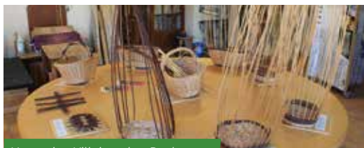
Vannerie - Villaines-les-Rochers