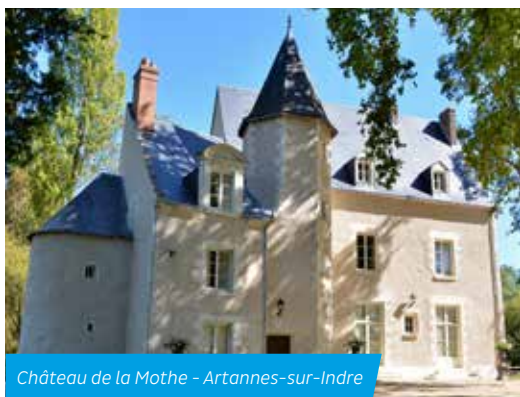
Château de la Mothe - Artannes-sur-Indre