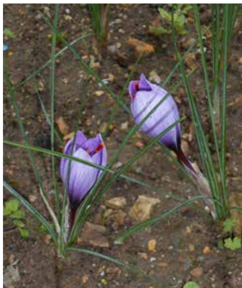
Producteur de truffes et safran - Cheillé

Présentation de la culture et de l'utilisation culinaire du safran et dégustation