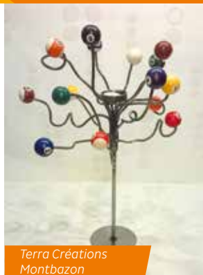
Terra Créations Montbazon

Samedi et dimanche : 10h-12h / 14h-19h Terra Créations - Laurent RENAUD Résidence d'artistes, les Deux-îles 31 Rue des Moulins