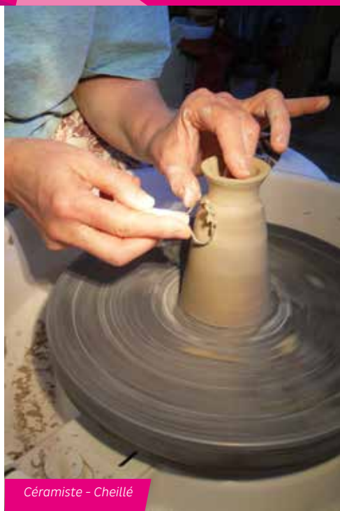
Céramiste - Cheillé

Démonstration coulage porcelaine et façonnage d'un jardin d'Eden