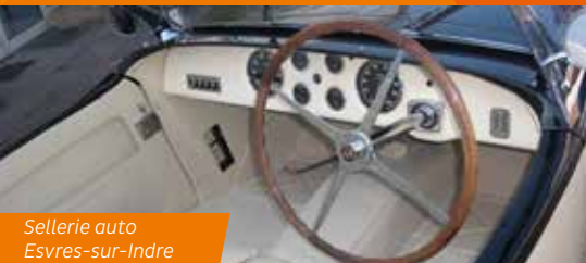
Sellerie auto Esvres-sur-Indre

🏰 Pigeonnier du Fuye 8 impasse du Château Samedi : 10h-12h / 14h-18h Visite de la Fuye du XV ème et explications du propriétaire