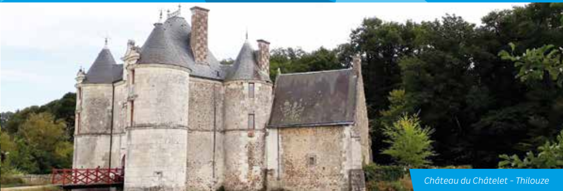
Château du Châtelet - Thilouze