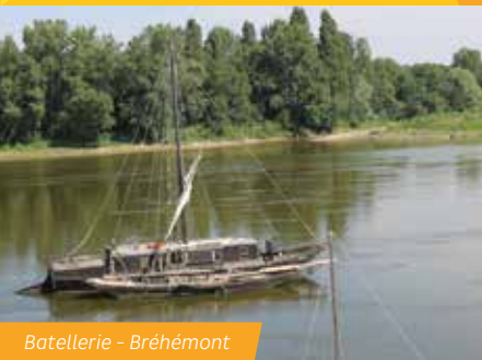
Batellerie - Bréhémont