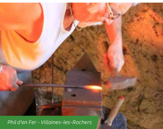
Phil d'en Fer - Villaines-les-Rochers