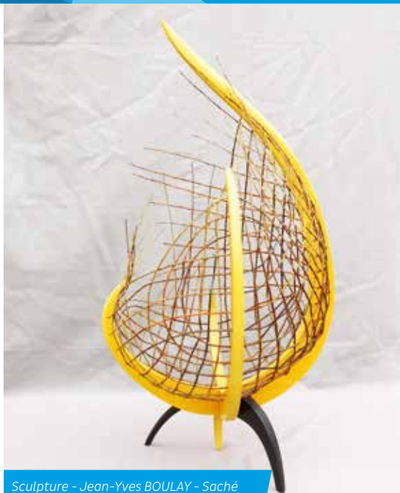
Sculpture - Jean-Yves BOULAY - Saché