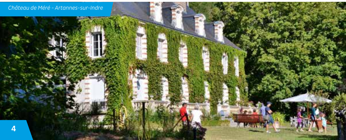
Château de Méré - Artannes-sur-Indre