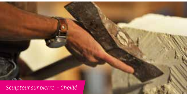
Sculpteur sur pierre - Cheillé